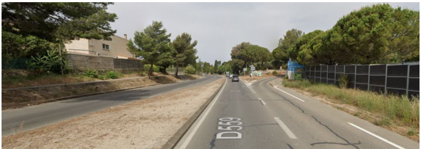
Vue au niveau de l'intersection avec chemin des Plaines Barannes

Pétition soutenue par UTOP VÉLO , l'association dédiée à la promotion de l'usage du vélo en ville, à La Ciotat et Ceyreste !